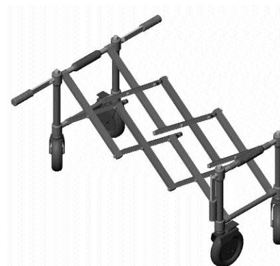
Z 501 F Church Truck with handles Carrello Funerario con Maniglie